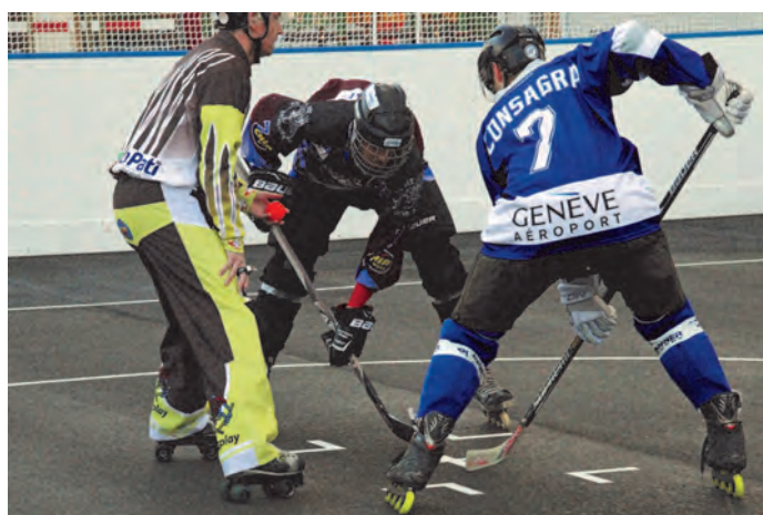
Le Inline Hockey Club d'Aire-la-Ville a pris ses quartiers au coeur de la nouvelle zone sportive.

Un montant pour des travaux divers avait été prévu sur cette rubrique lors de la présentation du budget 2015. Il a permis de couvrir un imprévu survenu lors de la réfection du préau de l'école.