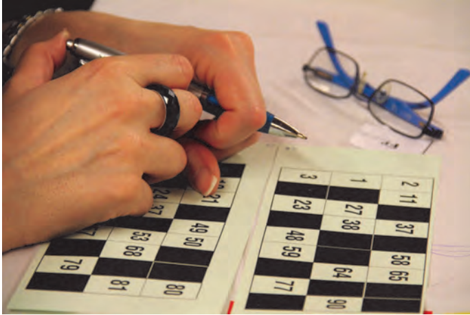
Parmi les nombreuses animations proposées à nos aînés, un repas suivi d'un loto ont été organisés par l'Aire-de-Rien.