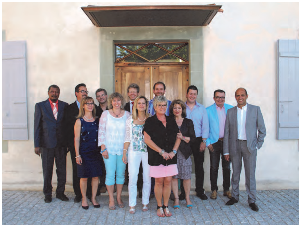
Les conseillères et conseillers municipaux élus pour la législature 2015-2020 posent devant l'entrée de la nouvelle mairie.

Conseillères et conseillers municipaux élus pour la législature 2015 - 2020