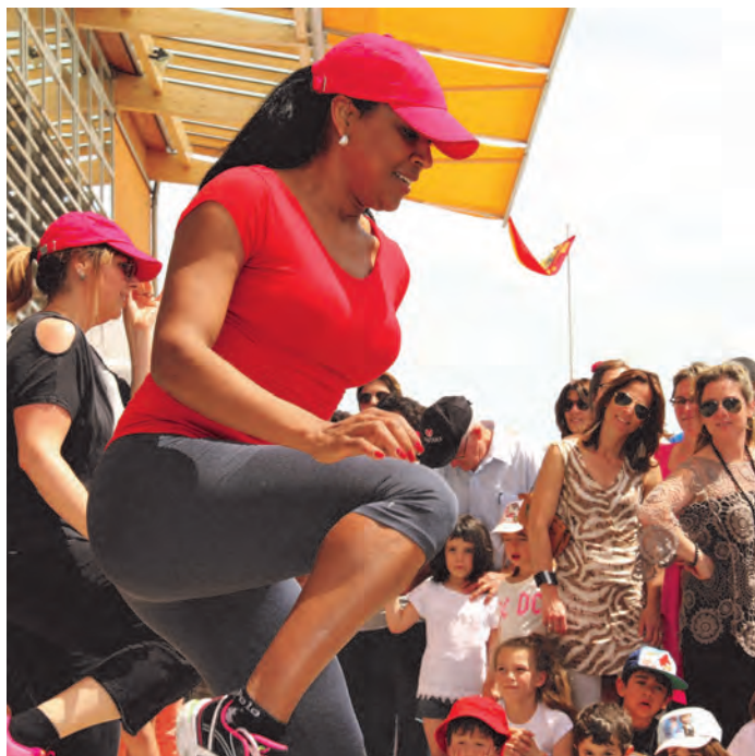
Démonstration de zumba sous un soleil radieux, à l'occasion de la fête du village, le 31 mai 2015.