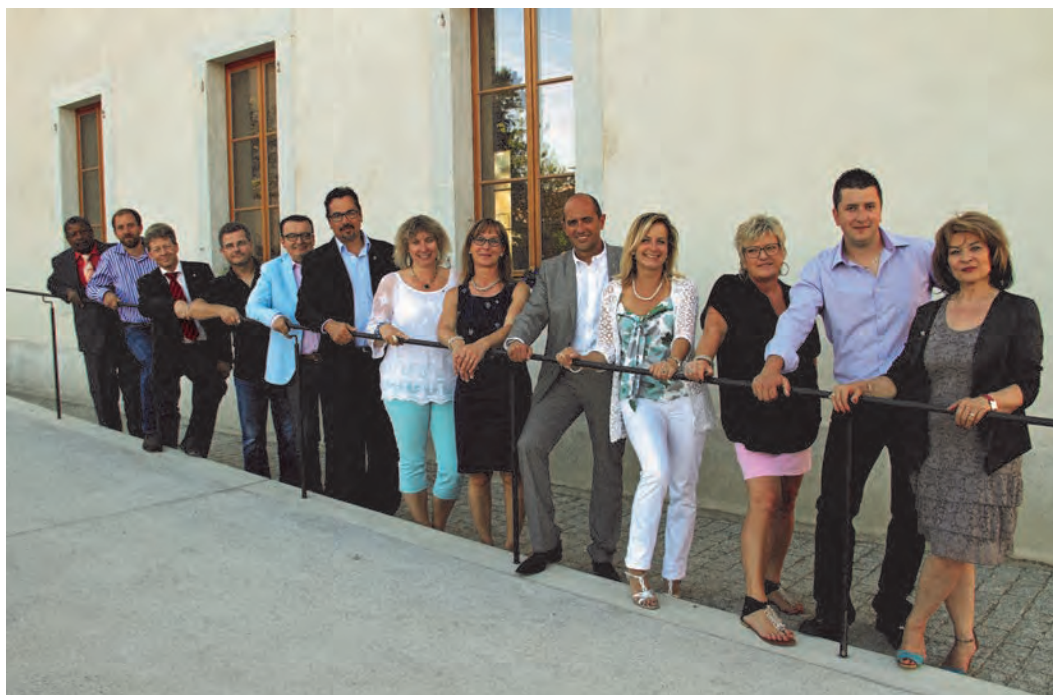
Les conseillères et conseillers municipaux élus pour la législature 2015-2020 devant les fenêtres de la nouvelle salle du Conseil.

Conseillères et conseillers municipaux élus pour la législature 2015 - 2020