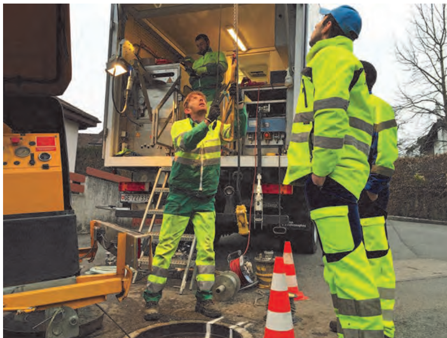
Les collecteurs d'eaux usées de la Colline aux Oiseaux ont été chemisés.

La commune d'Aire-la-Ville a rejoint le réseau agro-environnemental nouvellement créé dans la région de la Champagne. Ce réseau vise à valoriser des éléments paysagers et patrimoniaux selon des périmètres intercommunaux. Il s'agit de favoriser des surfaces de biodiversité en reliant entre eux des milieux naturels d'intérêt particulier, et en encourageant les connexions au sein des espaces agricoles.