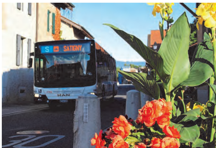
95 personnes ont reçu une subvention pour l'achat de leurs abonnements annuels TPG.