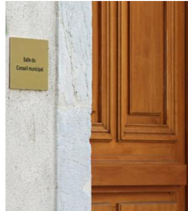
▲ Le local de vote est transféré dans la salle du Conseil municipal.