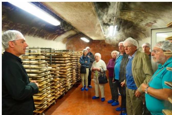
▲ Nos aînés à la découverte de la fromagerie d'un affineur, lors d'une sortie dans le massif des Aravis.

300 journées de camps/colonies de vacances ont été subventionnées à raison de CHF 15.00 par jour et par enfant domicilié sur la Commune.