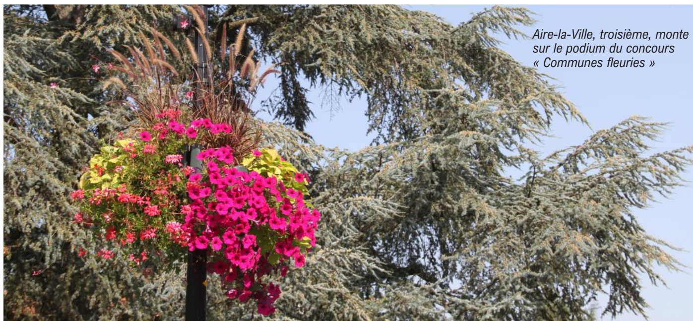
Aire-la-Ville, troisième, monte sur le podium du concours « Communes fleuries »