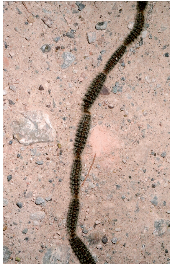
7. Processions au sol, William © M. Ciesla, Forest Health Management International, Bugwood.org ▶