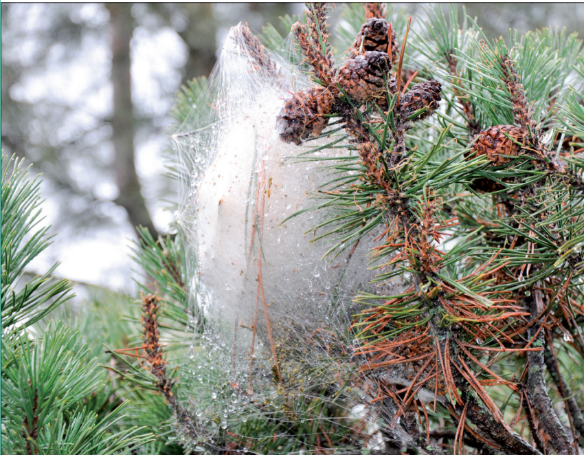
▶ 6. Nid d'hiver