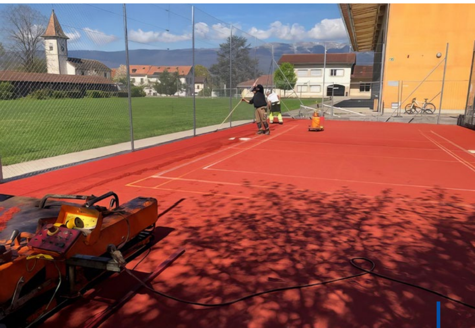
Le mini-tennis tout beau tout neuf