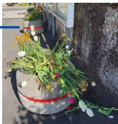
Un des pots de fleurs saccagé