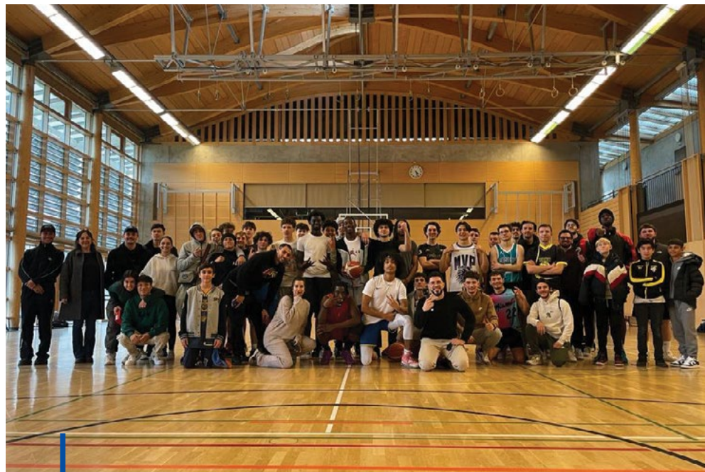
Félicitations aux organisatrices et organisateurs, ici entourés par des membres des équipes du tournoi de basket

Bar à crêpes et rythme musical ont ambiancé la septantaine de jeunes réunie durant cette journée sportive et conviviale.