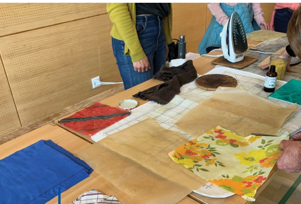
Fabrication de Bee's wrap lors du rallye