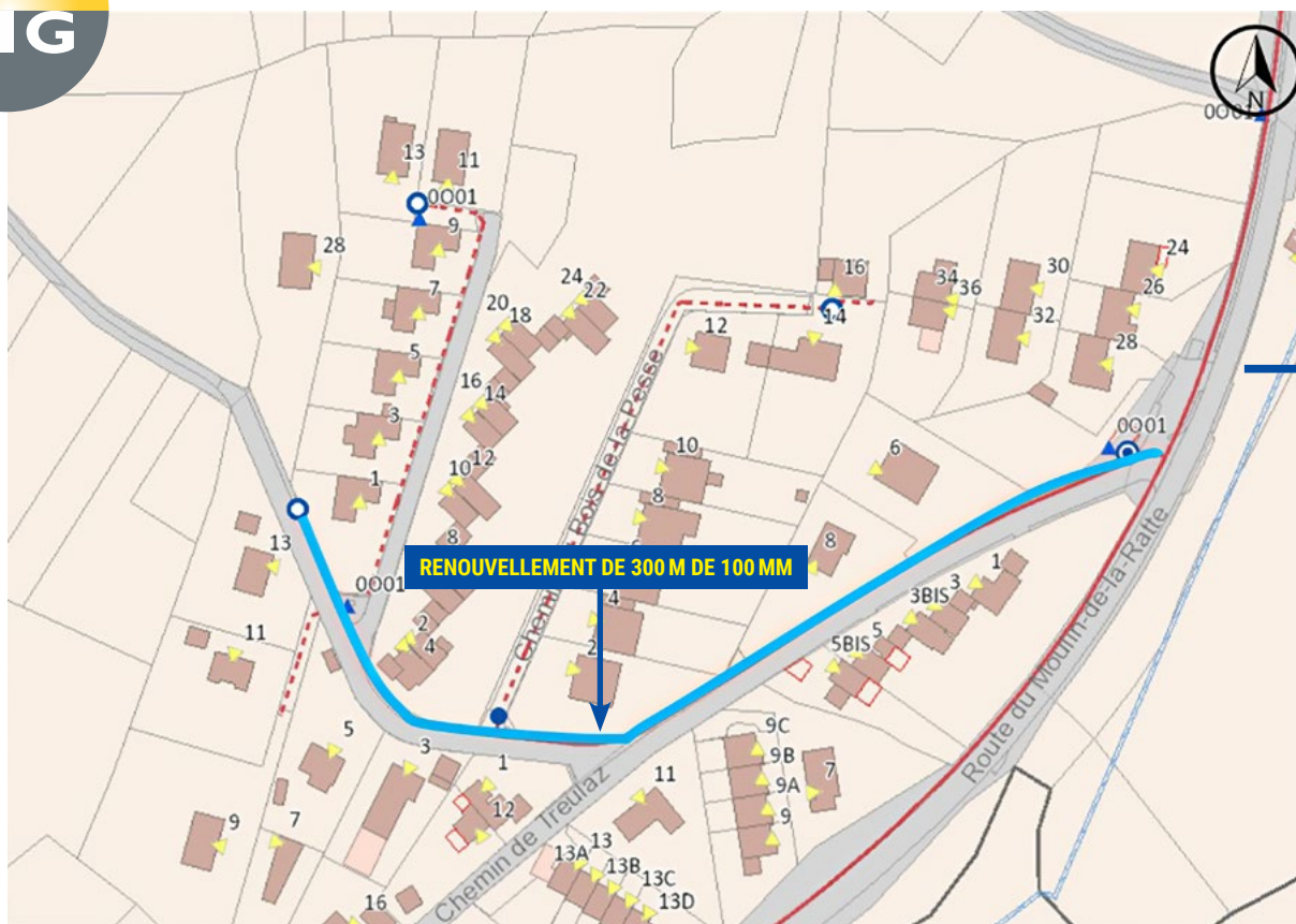
Le plan des chemins concernés par les travaux des SIG